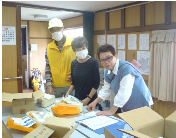
医薬衛生品の点検では、使用期限、個数、必要なものが備えられているかをチェックしました

十月二十七日(日)、町の防災組織活動部(副班長)と担当幹事計十二名が集まり、自治会集会所で、年一回の防災備蓄庫の点検が行われました。