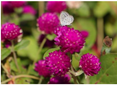
初夏から咲き続け、私たちの目を楽しませてくれる千日紅 (10月14日 やまもも公園)