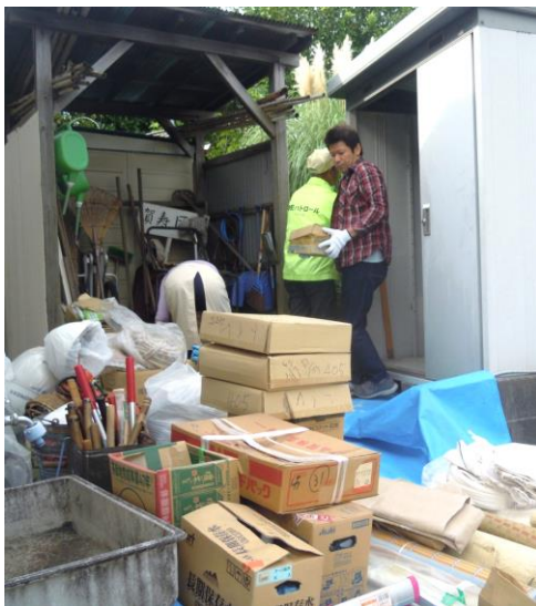
倉庫内の防災用品をすべて運び出し、状態、個数などを点検しました