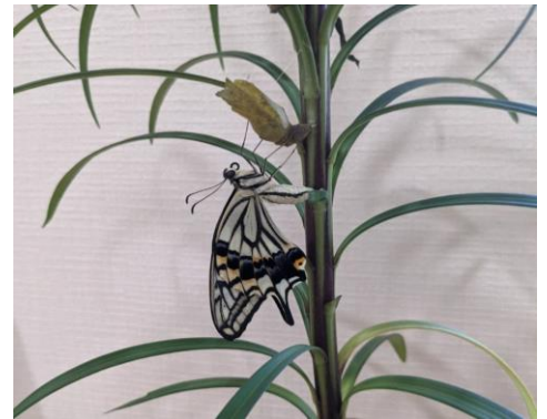
アゲハ蝶がサナギから羽化したところです

わが家の庭には、ときどきアゲハ蝶が飛んできては、みかんや山椒の木に卵を産んでいきます。サナギになるまでには、たくさん葉を食べるので、ときには困っている方もいらっしゃると思います。でも、その成長過程を見守っていくと、無事に羽化（蝶々になる）した姿は感動的です。そして、ひらひらと空に舞い上がっていく姿は優雅で、見ていて感慨深いものがあります。