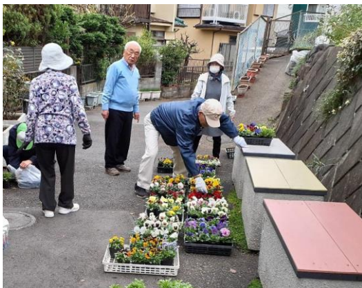
好みの色の苗を持ち帰り、会員各自の庭、道路脇などに植え込みます

10月29日(火)、集会所前にて、花苗配布会が行われました。パンジー、ビオラとノースポールなどの苗が会員に配られました。